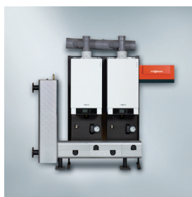
Ramă de montaj în cascadă (în linie)

Vitodens 200-W este un cazan mural cu funcționare pe combustibil gazos, cu design compact și elegant, ce oferă un raport ideal preț/performață și este confortabil în ceea ce privește încălzirea și prepararea apei calde menajere.