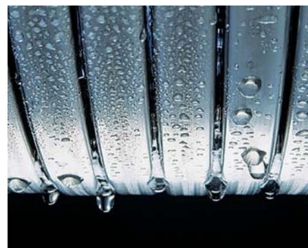
Suprafețe de transfer termic Inox-Radial

Cazanul Vitodens 222-W este un produs ideal pentru instalarea în clădiri noi datorită programului de uscare a șapei de care dispune.